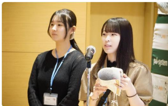
運営委員会特別賞に選ばれた「西区BBS会」